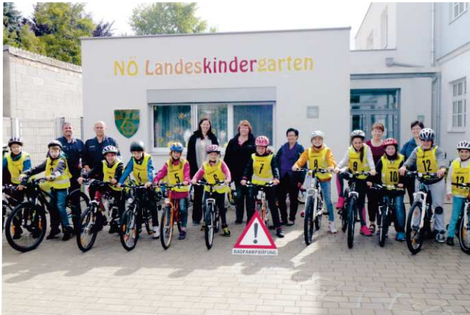
Die Volksschulkinder der 4. Klasse legten am 22. Juni 2015 die Radfahrprüfung ab. Alle haben bestanden - herzliche Gratulation!