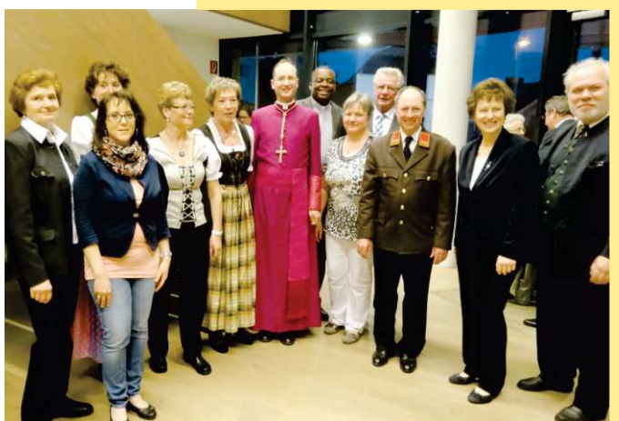
Im Anschluss an die Hl. Messe wurde im Kulturhaus Eibesbrunn ausgiebig das 200-jährige Bestehen der Pfarrkirche Eibesbrunn gefeiert