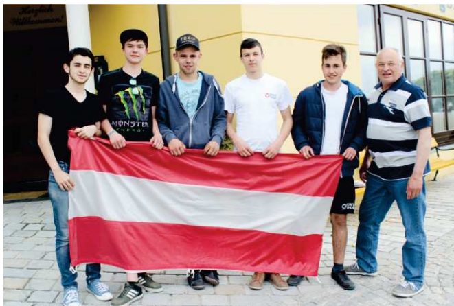
Im Mai waren die Jungmänner zur Musterung nach St. Pölten rekrutiert. Nach ihrer Rückkunft lud sie die Gemeinde zu einem gemeinsamen Mittagessen