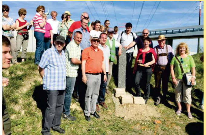
Beim diesjährigen Gmoari wurde im Beisein von Gemeindevertretern beim Dreiländereck Eibesbrunn, Obersdorf u. Seyring ein Grenzstein gesetzt