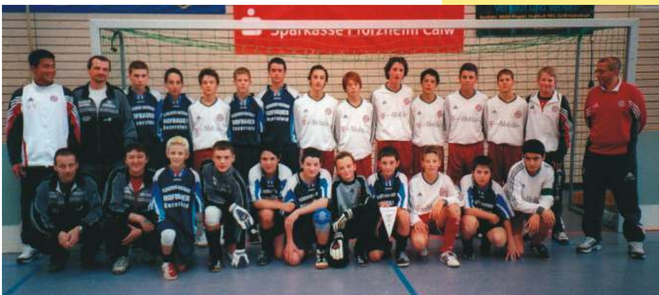
U14-Mannschaften der SG Großebersdorf/Enzersfeld und FC Bayern München