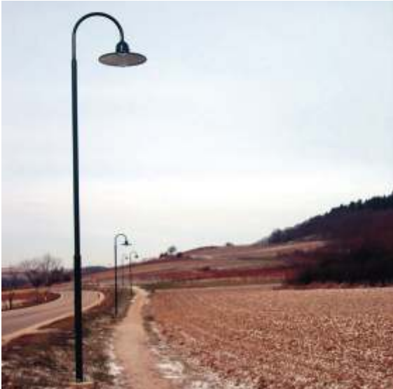
Beleuchtung des Gehweges Großebersdorf - Putzing/See

Weitere Anregungen, Laternen aufzustellen, kamen aus der Bevölkerung. Die Aufstellung erfolgt im März/April 2005.