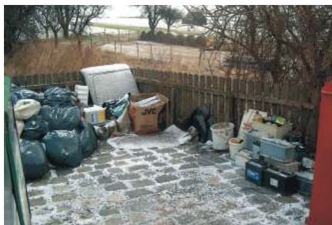
Sammelstelle in Putzing (Vereinhaus)

Die nachstehend abgebildete Müllinsel in Putzing hinter dem Vereinhaus, ist ein Beispiel für die schlechte Entsorgungsmoral. Videoüberwachungen werden verstärkt durchgeführt, erste Anzeigen laufen.