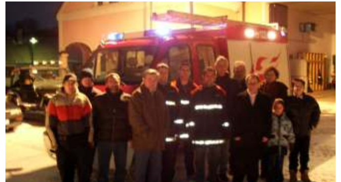
Empfang des neuen KLFW in Putzing

Das neue Einsatzfahrzeug im Wert von €120.000,00 finanzierten zu je einem Drittel die FF Putzing, der Landesfeuerwehrverband und die Gemeinde.