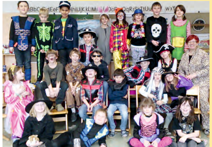
Die Kinder der 2. Klasse Volksschule beim närrischen Treiben am Faschingsdienstag