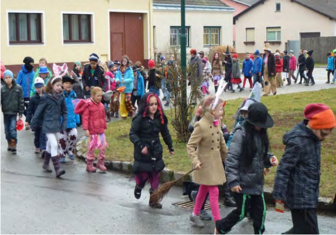
Faschingsumzug der Volksschulkinder durch das Ortszentrum vom Großebersdorf