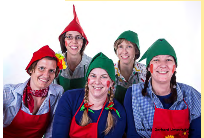
Die Gemeinde bedankt sich im Namen der Kinder für die tolle Organisation des Kinderfaschings