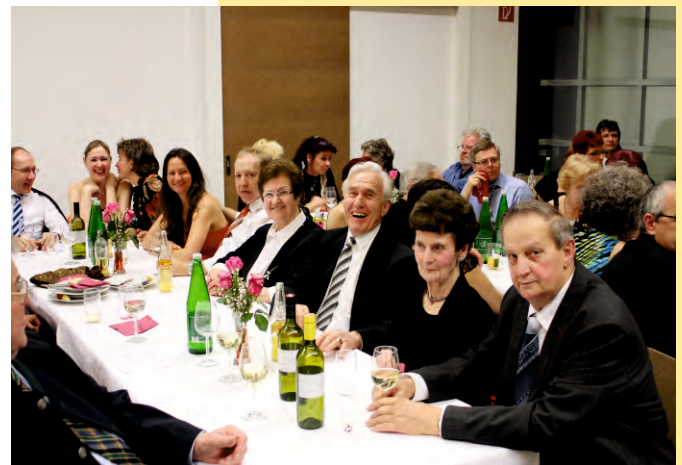
Ausgezeichnete Stimmung beim Feuerwehrball Eibesbrunn im neuen Kulturhaus