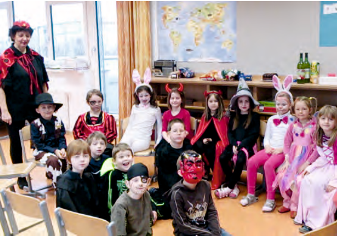
Auch die 1. Klasse Volksschule feierte am Faschingsdienstag mit tollen Kostümen